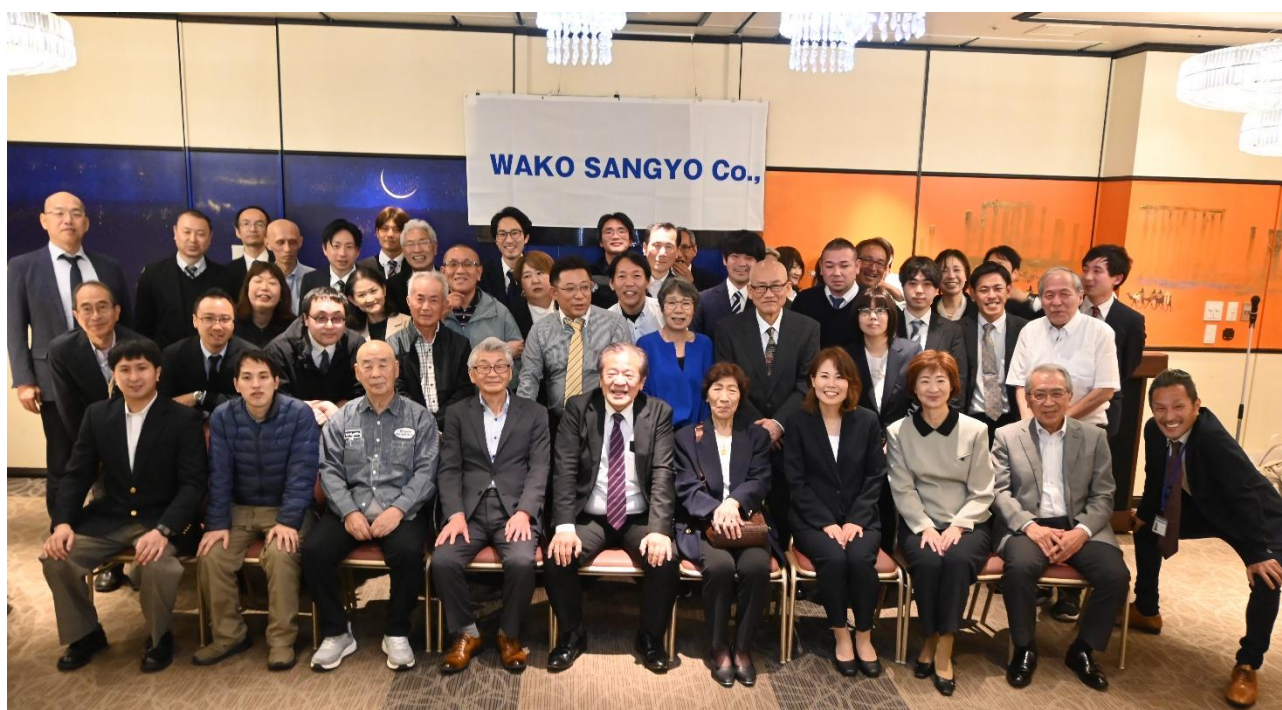
創立 66 周年記念式典及び永年勤続者・功労者表彰式後の宴席にて