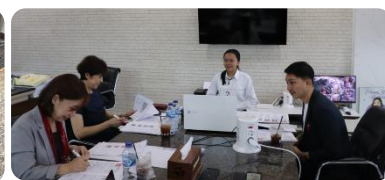
個別面接、グループワーク試験