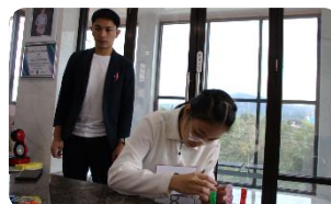
集中力・手先の器用さの試験