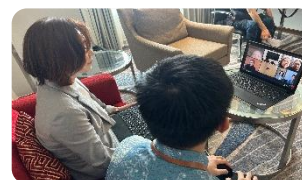
採用者の御家族とのオンライン面談