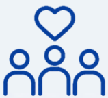
現場社員への想い

いきいきと楽しそうに働く姿は、お客様や周りの方に必ず伝わり、それが評価にも繋がります。そのため、どうすれば皆さんがいきいきと働けるかを常に考えています。