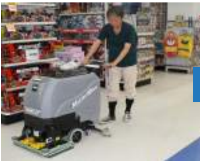
水研磨ワックス清掃