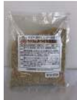
パウチ 40g 手で切れて便利です