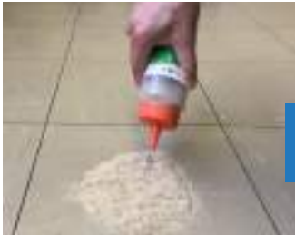
1. おう吐物を覆うように振り掛ける