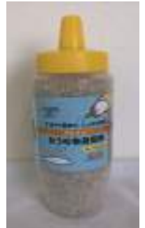
カーペット用 120g 除菌剤は配合していません