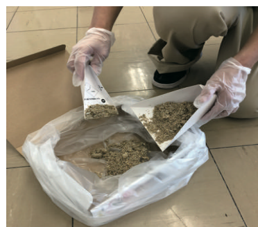
6) 凝固物をポリ袋に入れる