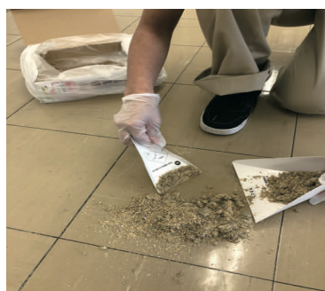
5) 固まったおう吐物を集める