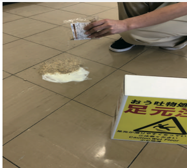
2) 凝固剤を振りかける