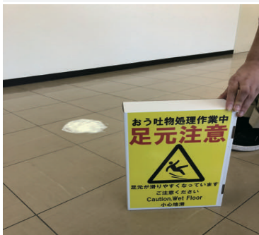
1) 箱の裏面”足元注意”を立てる

作業手順を動画で確認できます。箱側面のQRコードを読み取るか、YouTube『ワクスル』の検索でご覧いただけます。