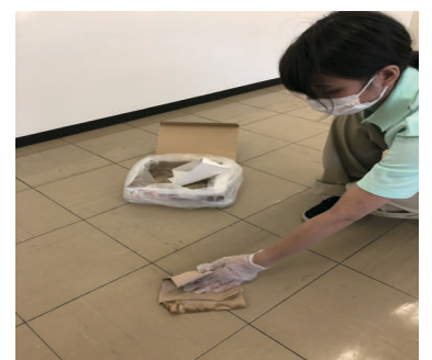
8) ペーパータオルで拭き上げる