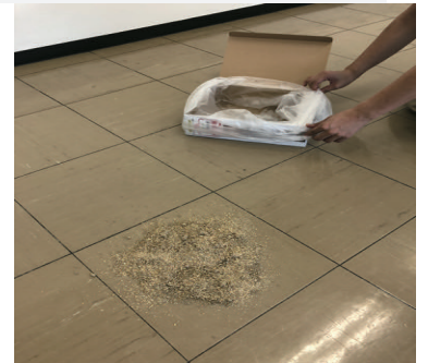
4) 救急箱にポリ袋をセットする